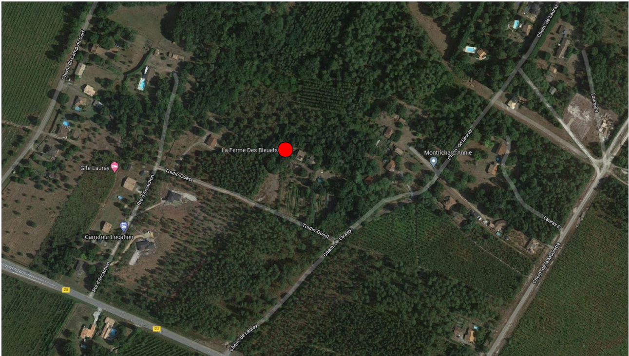
Figure 1 : localisation du site d'accueil (point rouge)